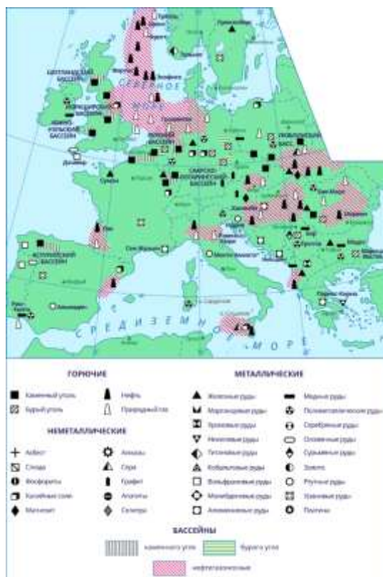
Минеральные ресурсы Зарубежной Европы

Лесные ресурсы относительно велики. Площадь лесных массивов составляет около 33% от общей площади региона. Значительными запасами выделяются страны Скандинавского полуострова (Швеция, Финляндия).