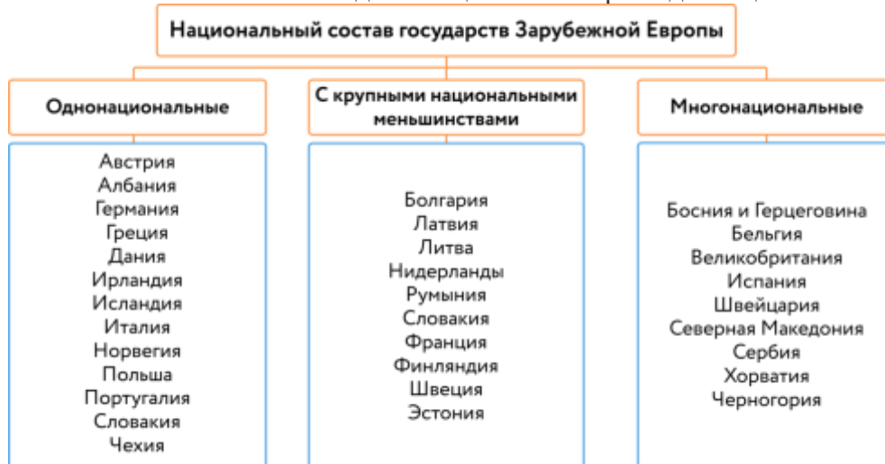
Национальный состав стран Зарубежной Европы

В Зарубежной Европе проживает более 60 народов, большинство относится к индоевропейской языковой семье. Подавляющее число стран однонациональные .